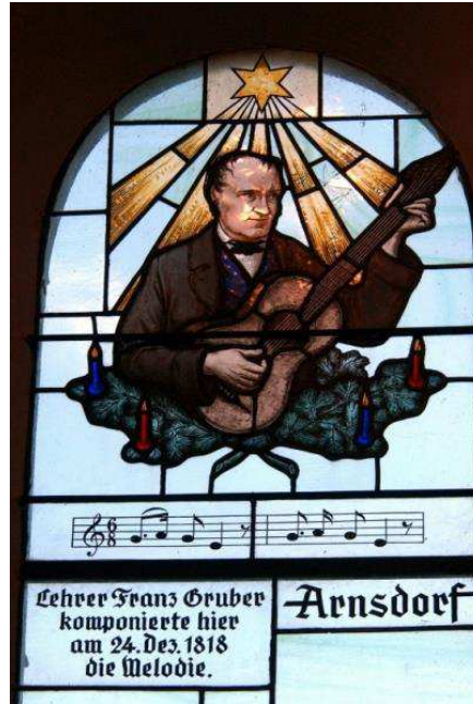
Vitrail chapelle de Oberndorf

Elle prend place dans les livres scolaires en Allemagne puis résonne bientôt dans les cérémonies religieuses, aussi bien catholiques que protestantes. Le clergé contribuera également à sa diffusion par les missionnaires.